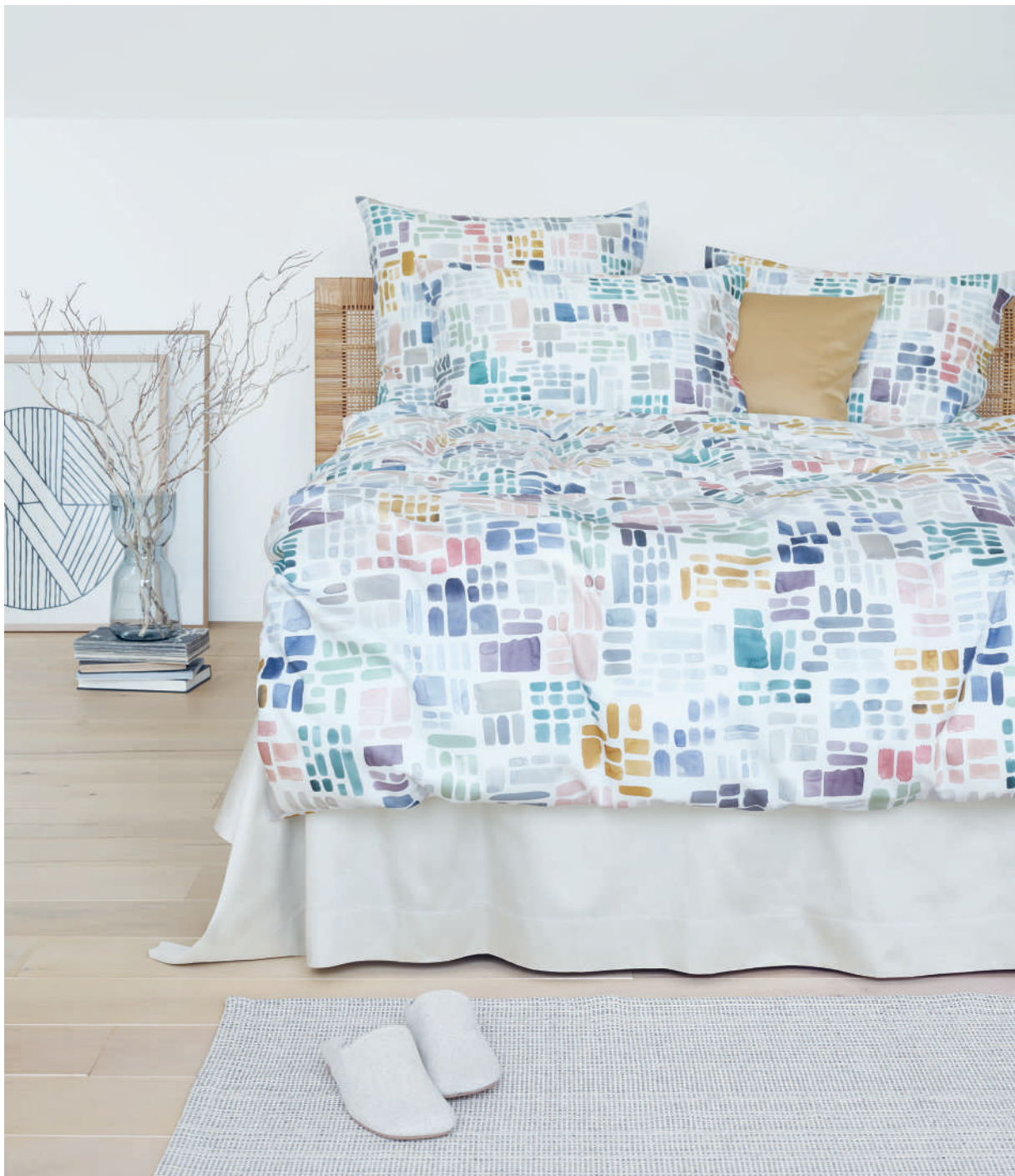
VALENTIN blanc | UNI savane - galet | Technik Aquarell

Spontane Pinselstriche mit Aquarellfarben, die sich in unterschiedlichen Stärken längs und quer, fast mosaikartig, verteilen: Eine herbstliche Farbwelt von neutralen Schiefertönen, hellem Grau, kühlen Blautönen bis hin zu pudrigem Rosa und dunklem Aubergine, die ganz leise an die verwinkelten Gassen eines Bergdorfes erinnert.