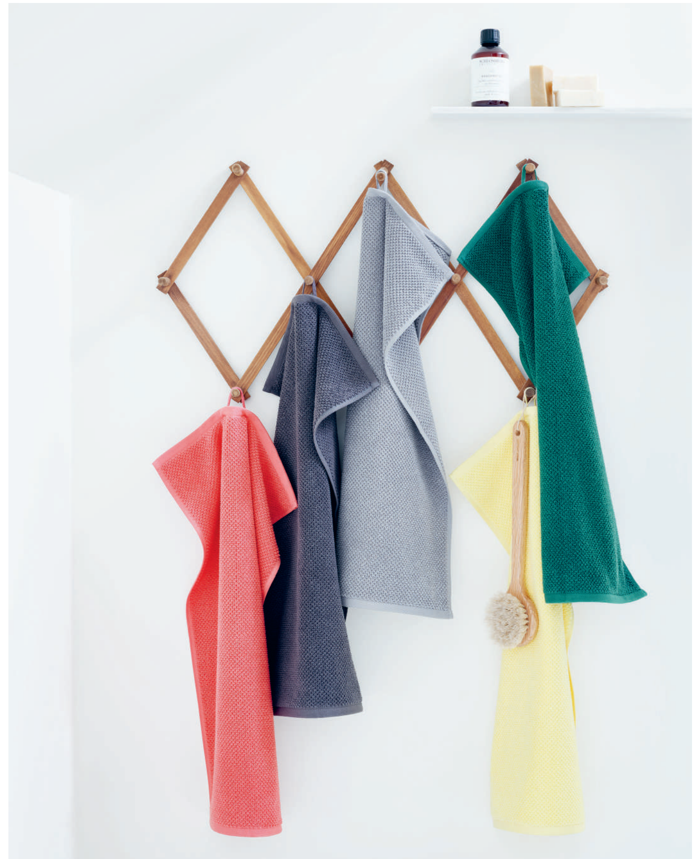
Frottier NOVA grapefruit - basalt - stone - sunshine - forest | Schlossberg WASCHEMITTEL

Neue Farben, von dezent bis knallig bunt, geben Frische und Abwechslung in die Farbauswahl der NOVA Frottierlinie. Aus 100% Bio-Baumwolle ist NOVA natürlich gut zu Ihrer Haut und schonend zur Umwelt.