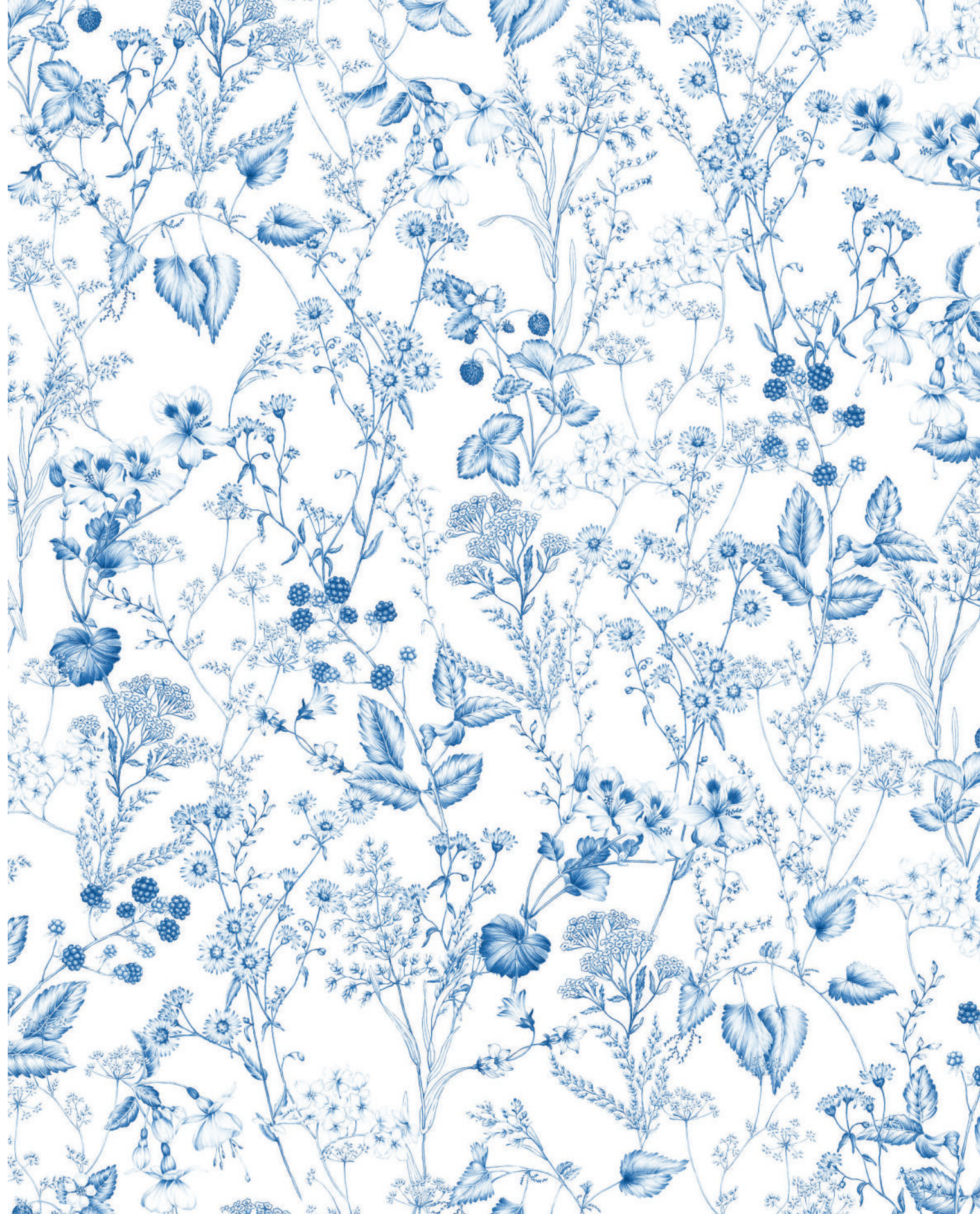
MAYA | Passende Unifarben adria, blanc, brise

Eine schöne, wilde Natur aus Wiesengräsern, Wildblumen, Kräutern und Beeren, eingefangen in reduzierter Zweifarbigkeit. Der Farbstift gleitet über das Papier und lässt die Naturwiese mit all ihren filigranen Strichen, zarten Schattierungen und feinen Details entstehen. Erinnerungen an die französische Blaumalerei auf Porzellan erwachen - mit ihr manch Lieblingskuchen-Duft aus Kindheitstagen.