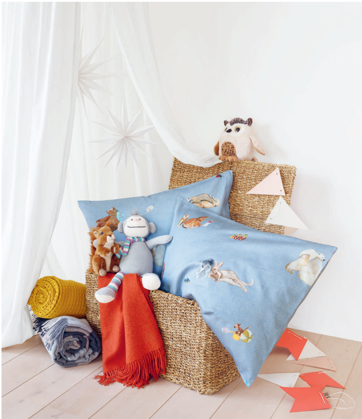
BONNE NUIT bleu | Plaids MILO brick + STAY honey + ANAIS blue | Technik Aquarell

Unter dem Sternenhimmel liegend, eingekuschelt und in bester Begleitung in den Schlaf finden: Die ebenso bunte, wie jetzt ruhend schlummernde Tierwelt hat ein Auge auf friedvolle und sorgenfreie Nächte. Für die kleinsten Träumer gibt es das Bettwäsche-Design auch in Kindergrösse.