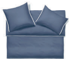
CLARK colombine - glace