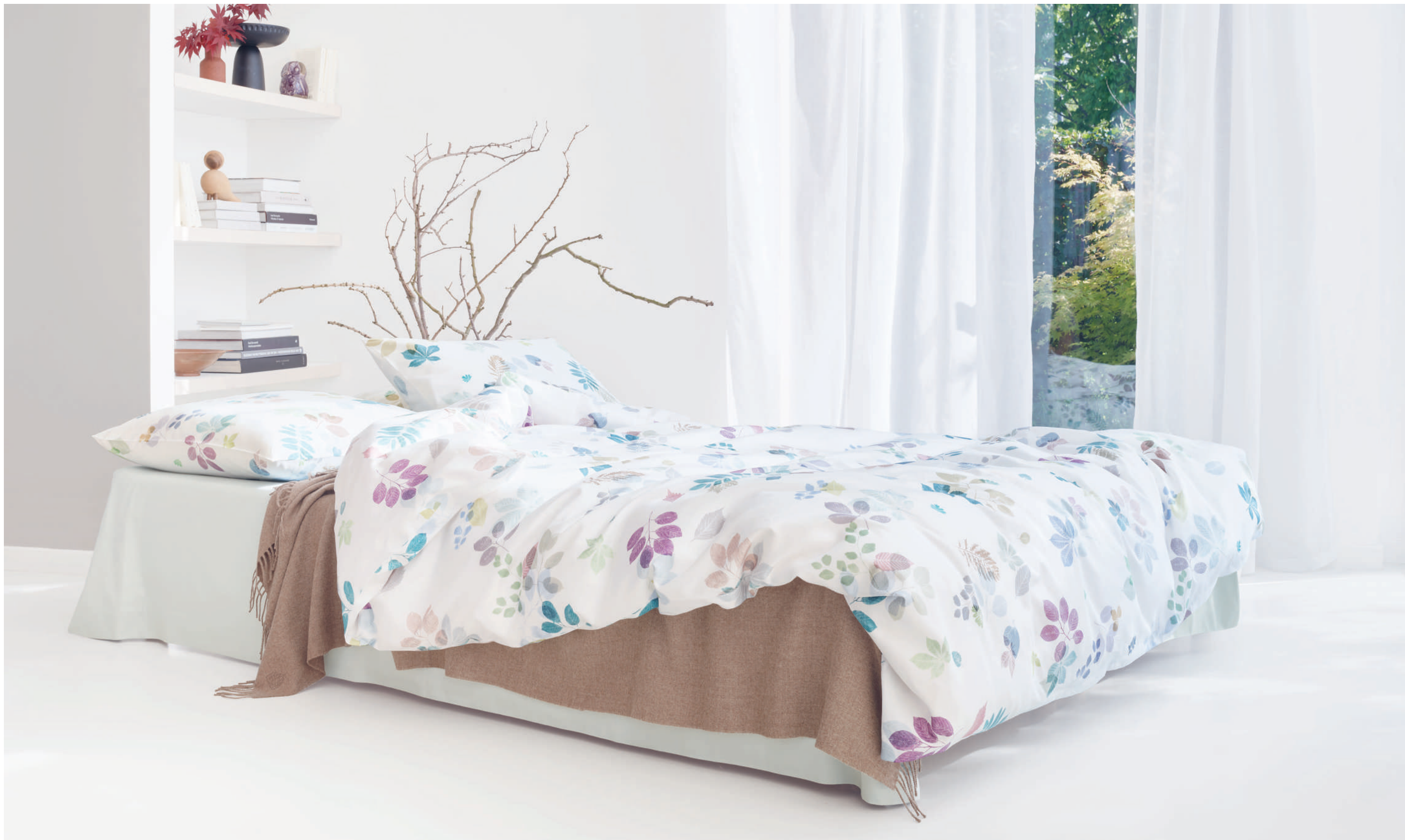
ELIV blanc | UNI nuage | Plaid MILO brown