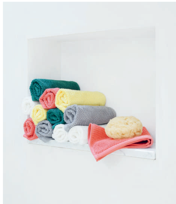
Frottier NOVA cotton - grapefruit - stone - basalt - forest - sunshine

Neue Farben, von dezent bis knallig bunt, geben Frische und Abwechslung in die Farbauswahl der NOVA Frottierlinie. Aus 100% Bio-Baumwolle ist NOVA natürlich gut zu Ihrer Haut und schonend zur Umwelt.