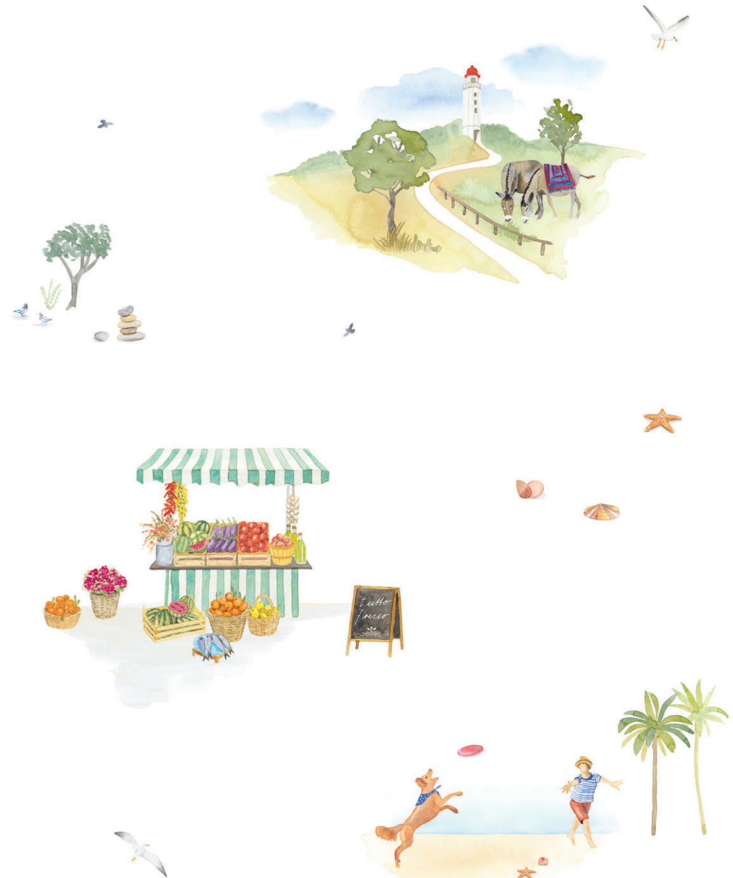
SIESTA | Passende Unifarben perle, brise, palmier, cayenne, thyme, hyacinthe