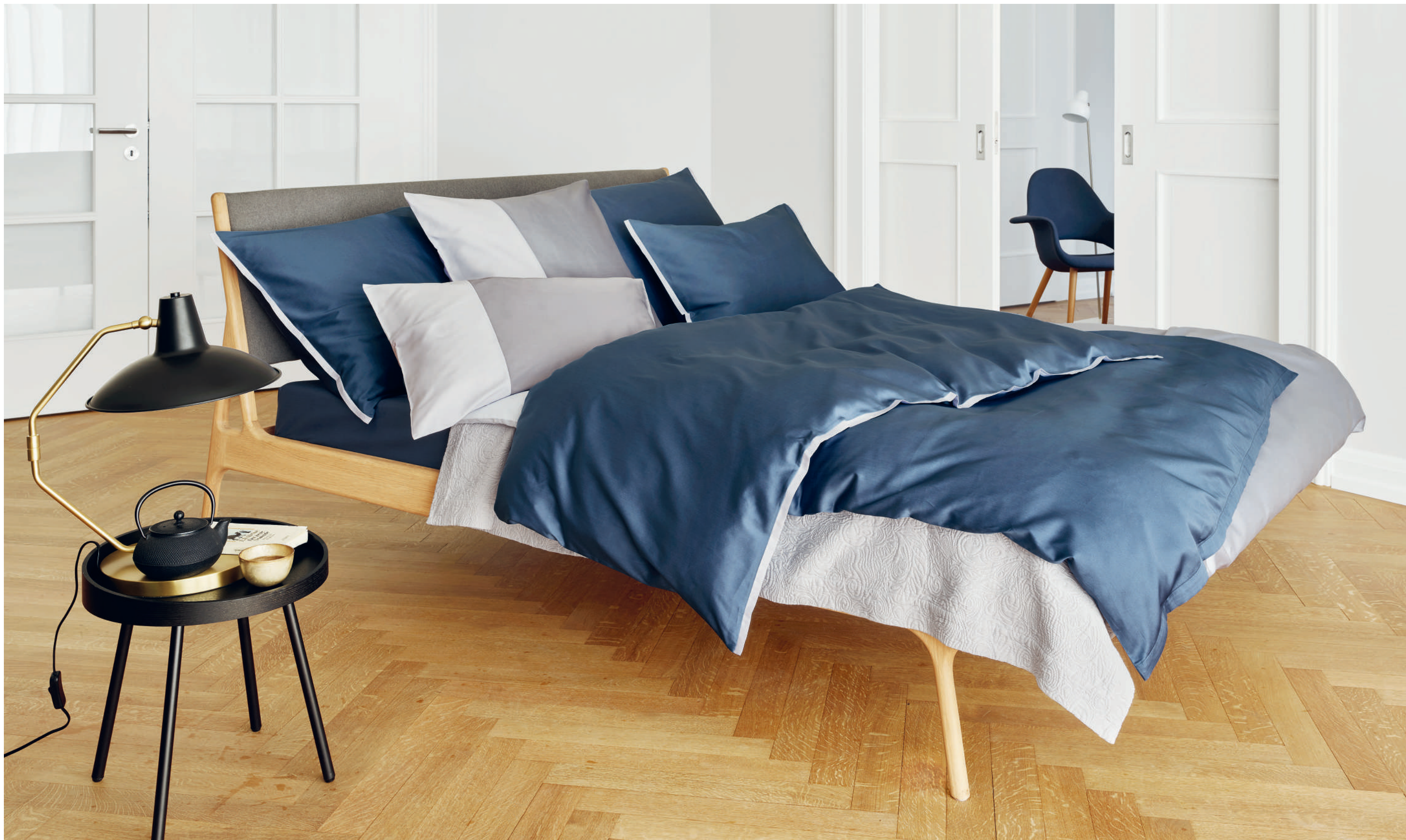
CLARK colombine - glace | ALLEN acier - glace | Coverlet CASTELLANO gris | UNI colombine