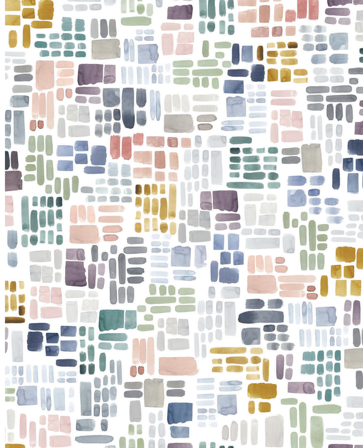
VALENTIN | Passende Unifarben perle, glace, acier, colombine, saumon, prune

Spontane Pinselstriche mit Aquarellfarben, die sich in unterschiedlichen Stärken längs und quer, fast mosaikartig, verteilen: Eine herbstliche Farbwelt von neutralen Schiefertönen, hellem Grau, kühlen Blautönen bis hin zu pudrigem Rosa und dunklem Aubergine, die ganz leise an die verwinkelten Gassen eines Bergdorfes erinnert.