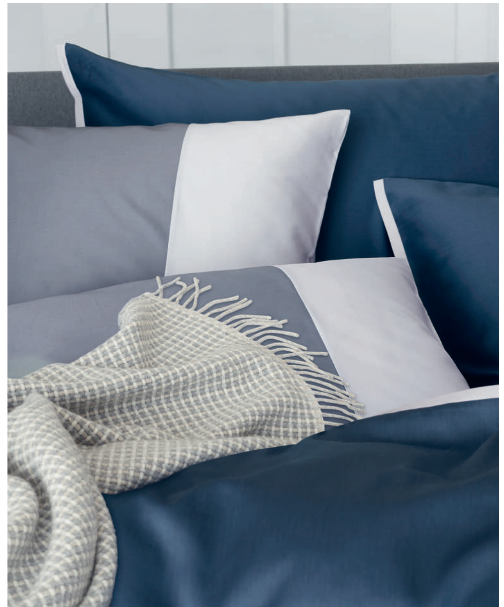
CLARK colombine - glace | ALLEN acier - glace | Plaid FELIX grey