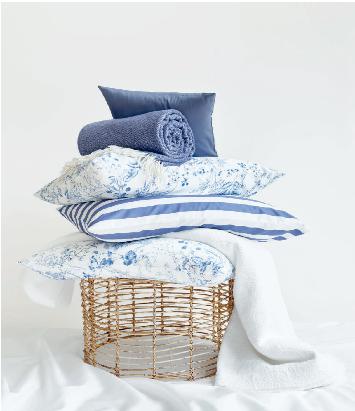
MAYA bleu | RITZ marine | UNI colombine - blanc | Coverlet CASTELLANO blanc | Technik Farbstiftzeichnungen

Eine schöne, wilde Natur aus Wiesengräsern, Wildblumen, Kräutern und Beeren, eingefangen in reduzierter Zweifarbigkeit. Der Farbstift gleitet über das Papier und lässt die Naturwiese mit all ihren filigranen Strichen, zarten Schattierungen und feinen Details entstehen. Erinnerungen an die französische Blaumalerei auf Porzellan erwachen - mit ihr manch Lieblingskuchen-Duft aus Kindheitstagen.