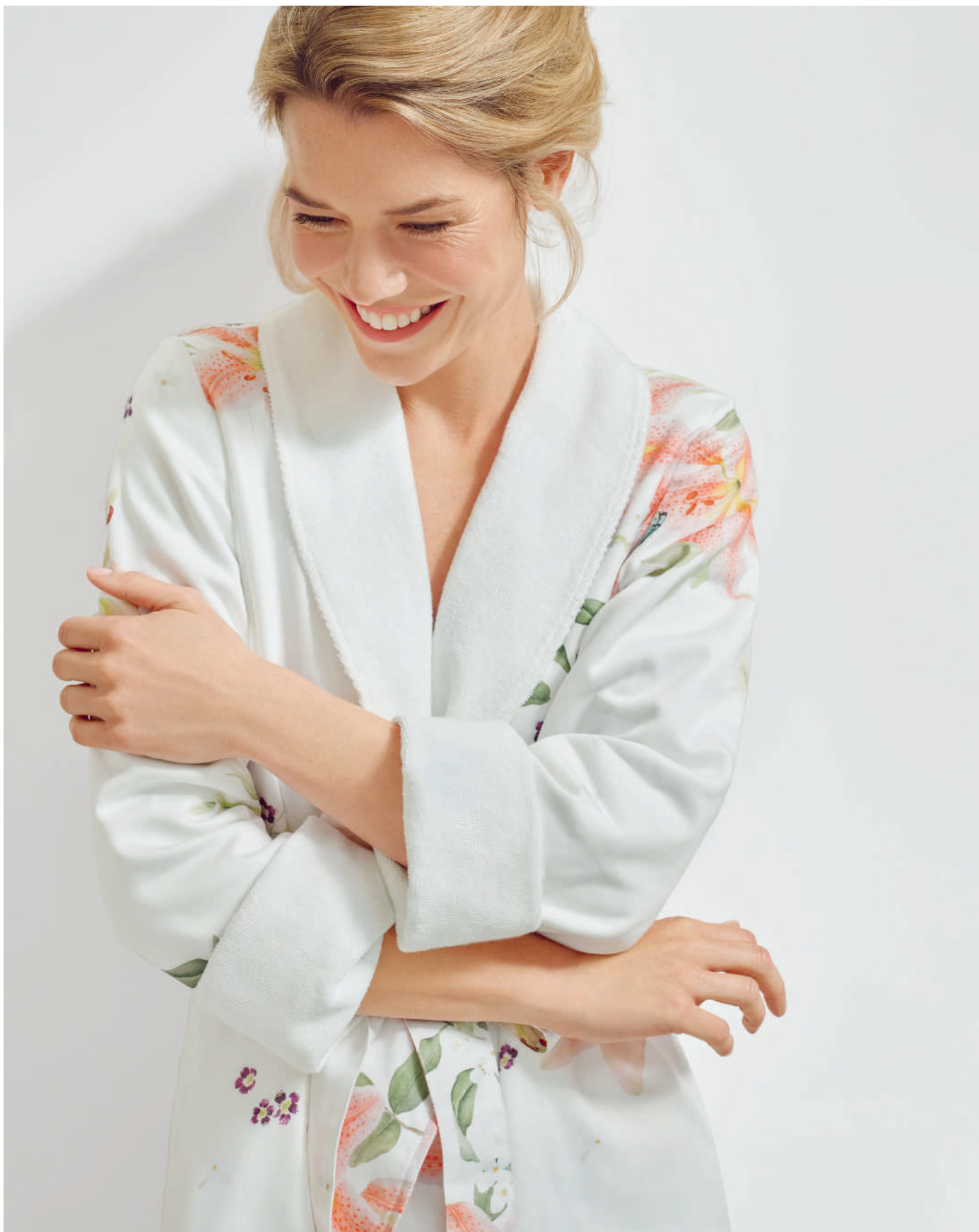
Morgenmantel LILIAN blanc