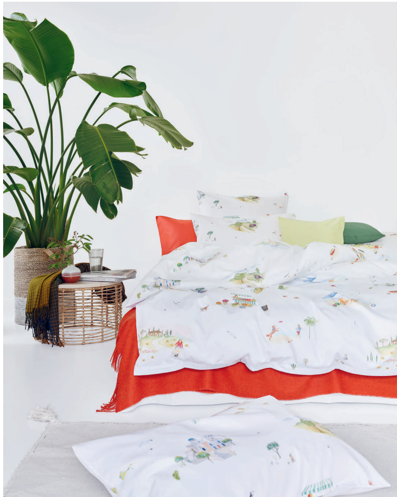
SIESTA blanc | UNI cayenne - limette - thyme - blanc | Plaids MILO brick + NANDO teal