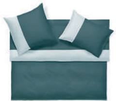
ALLEN sapin - nuage