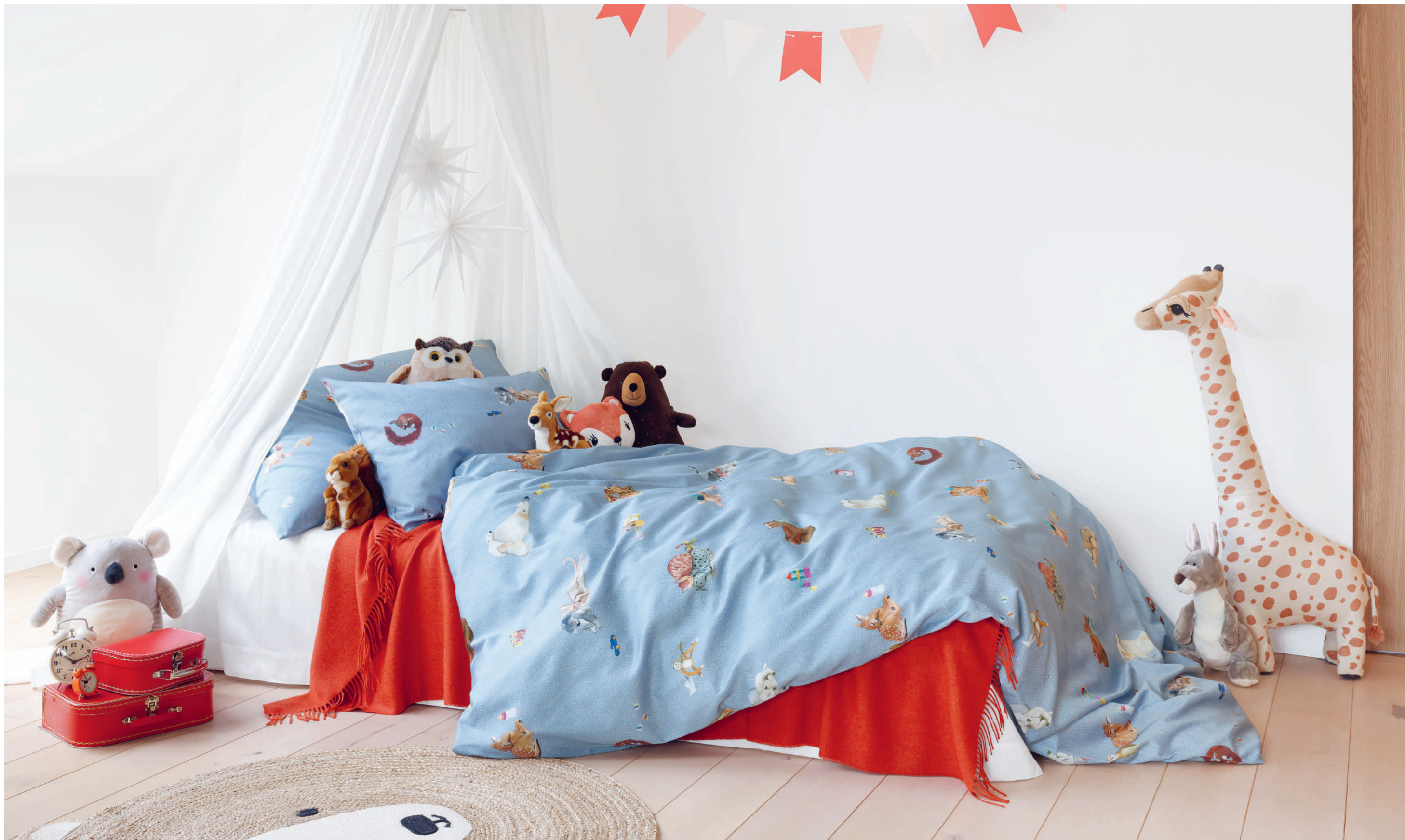
BONNE NUIT bleu | UNI blanc | Plaid MILO brick