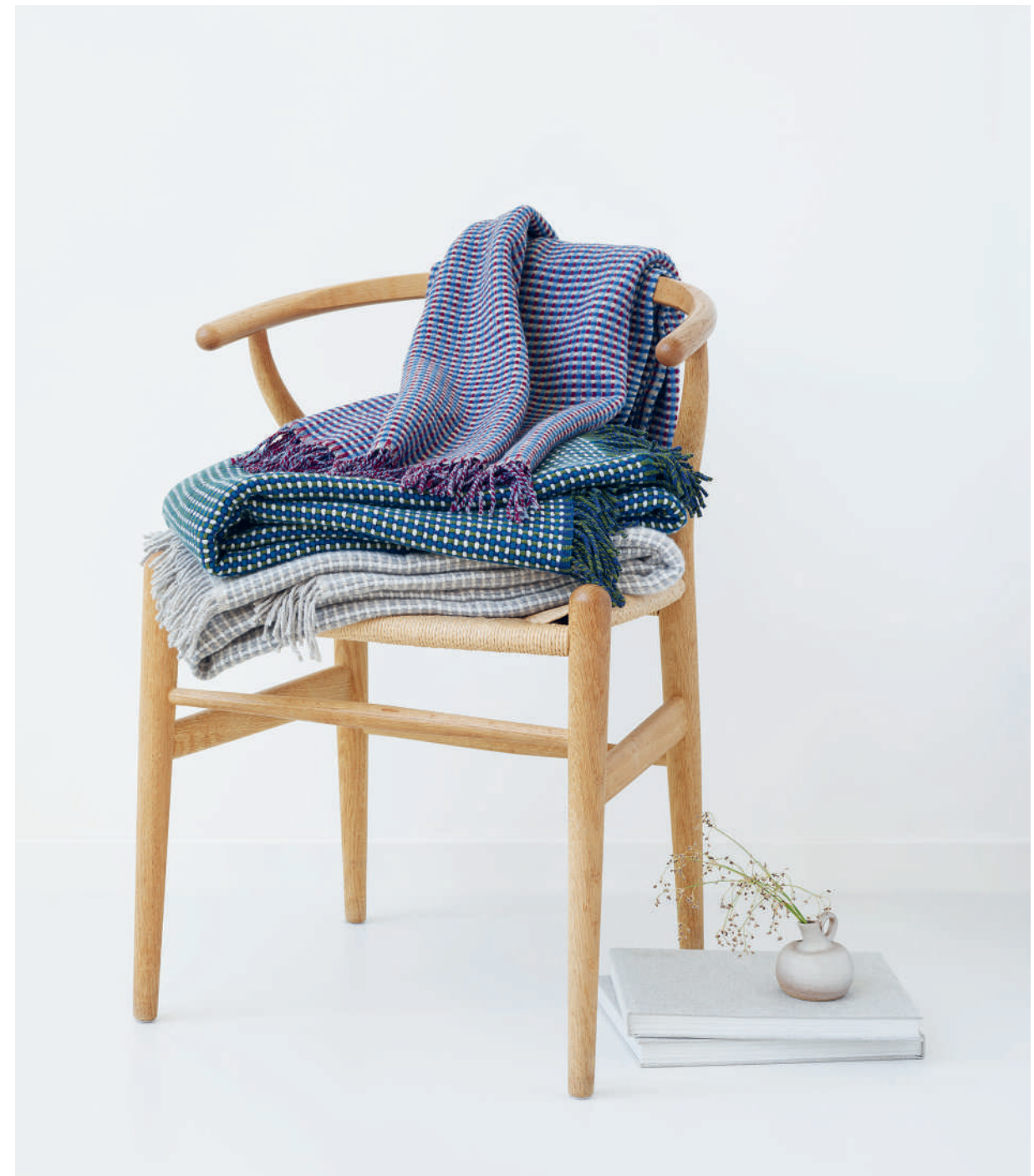
Plaids FELIX red - green - grey