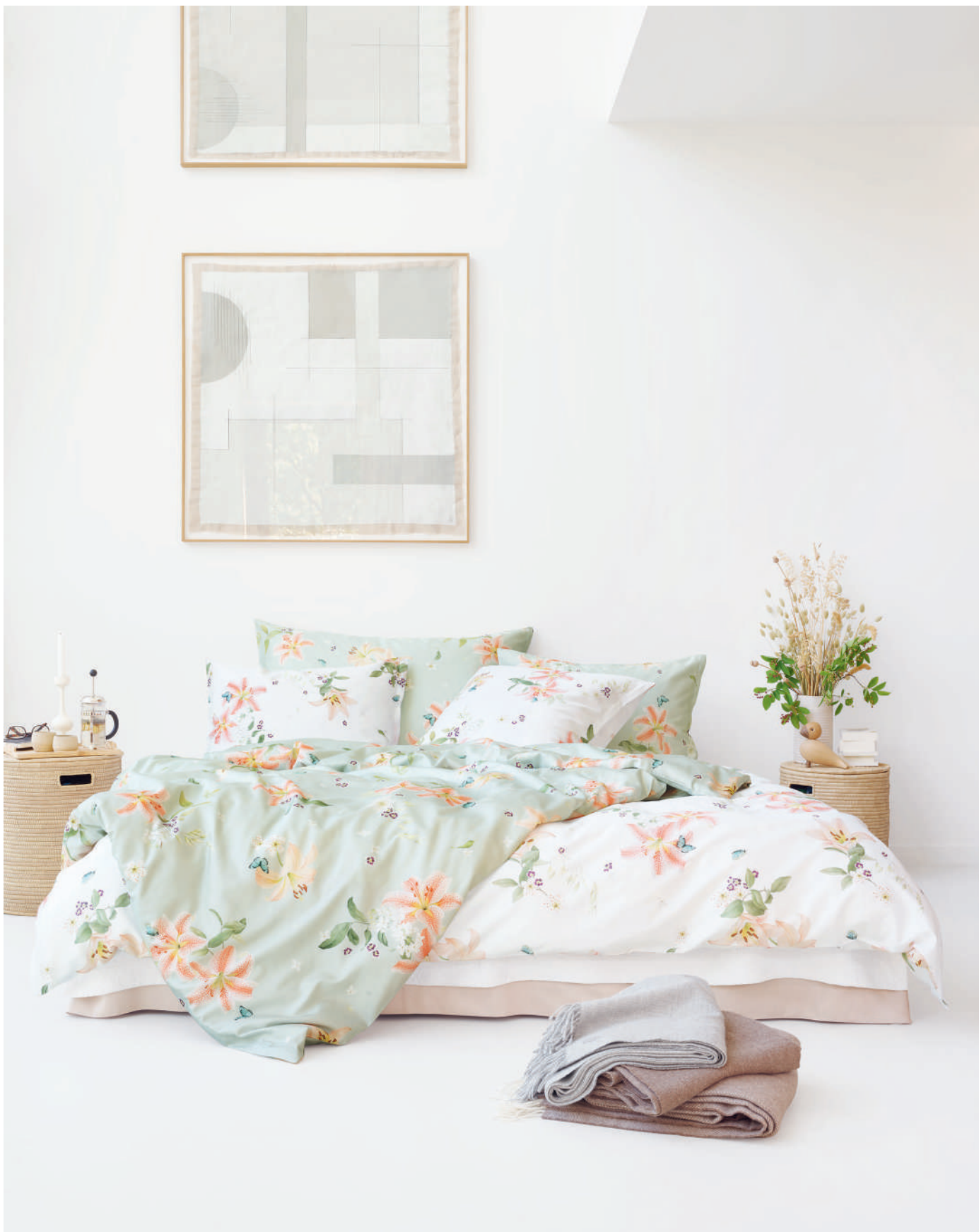
LILIAN blanc - vert | Coverlet CASTELLANO blanc | UNI perle | Plaids MILO grey - brown + ALIN brown