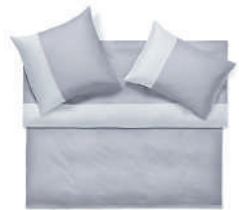
ALLEN acier - glace