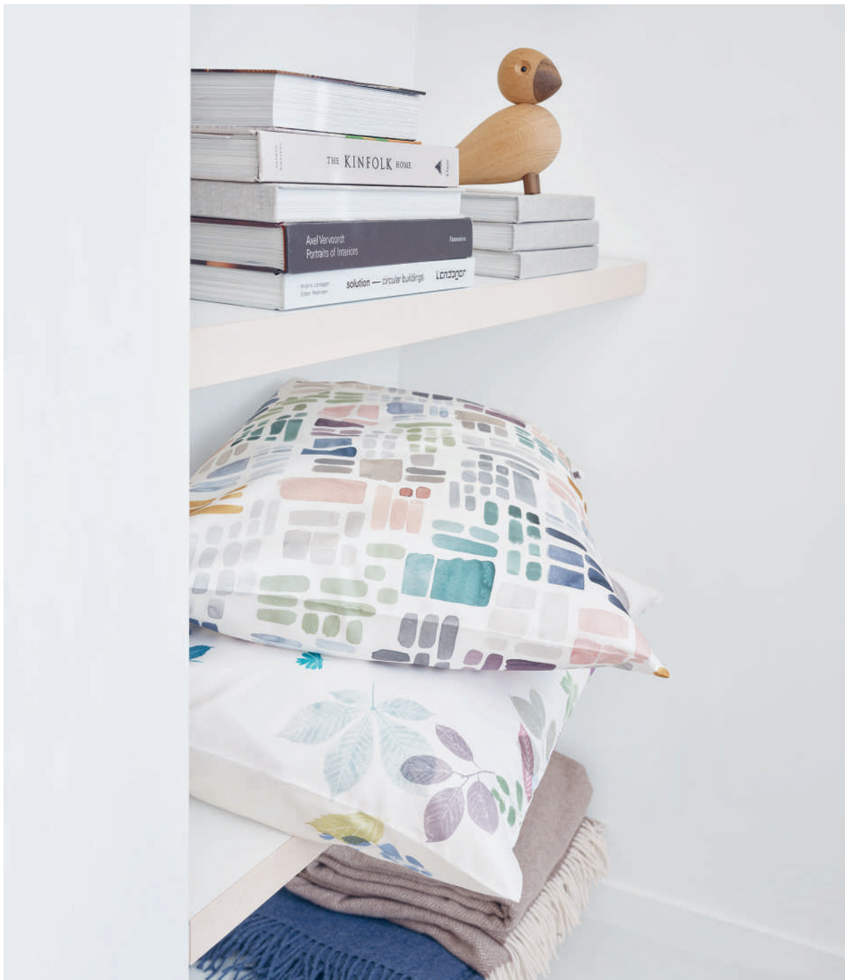
VALENTIN blanc | ELIV blanc | Plaids ALIN brown + MILO blue | Technik Druck-Abdruck mit Ölfarben

Die eindrucksvolle Handwerkskunst von Schlossberg vereint sich mit einem spielerischen Blättertanz auf dem Bett: Eine Vielzahl gesammelter Blätter taucht tief in Ölfarben aus kräftigem Petrol, frischem Lindengrün, warmem Rost und klarem Blau ein. Die Farbabdrücke lassen die zarte Blattstruktur und feinsten Adern detailreich erscheinen – als lägen sie Ihnen noch raschelnd zu Füßen.