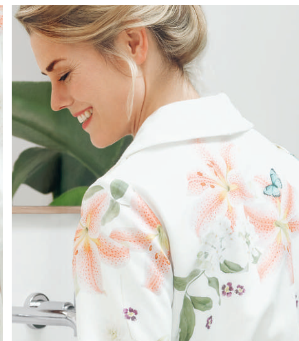
Morgenmantel LILIAN blanc

Ihr individueller Wohlfühlmoment im Badezimmer nach dem Aufstehen: Kuschelig weich, dank Frottier-Innenfutter und strahlend elegant durch das All-over-Lilienblüten-Design.