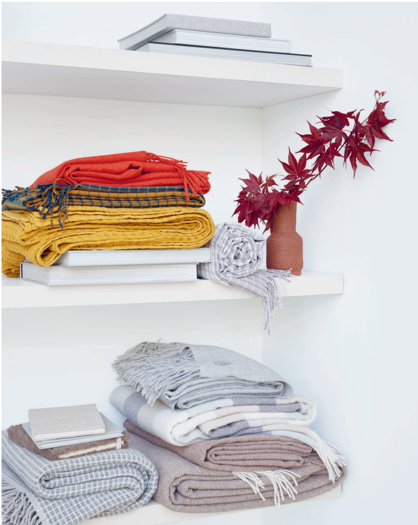
Plaids MILO brick + NANDO teal + STAY honey + NANDO taupe + MILO grey + ANAIS beige + MILO brown + ALIN brown + FELIX grey