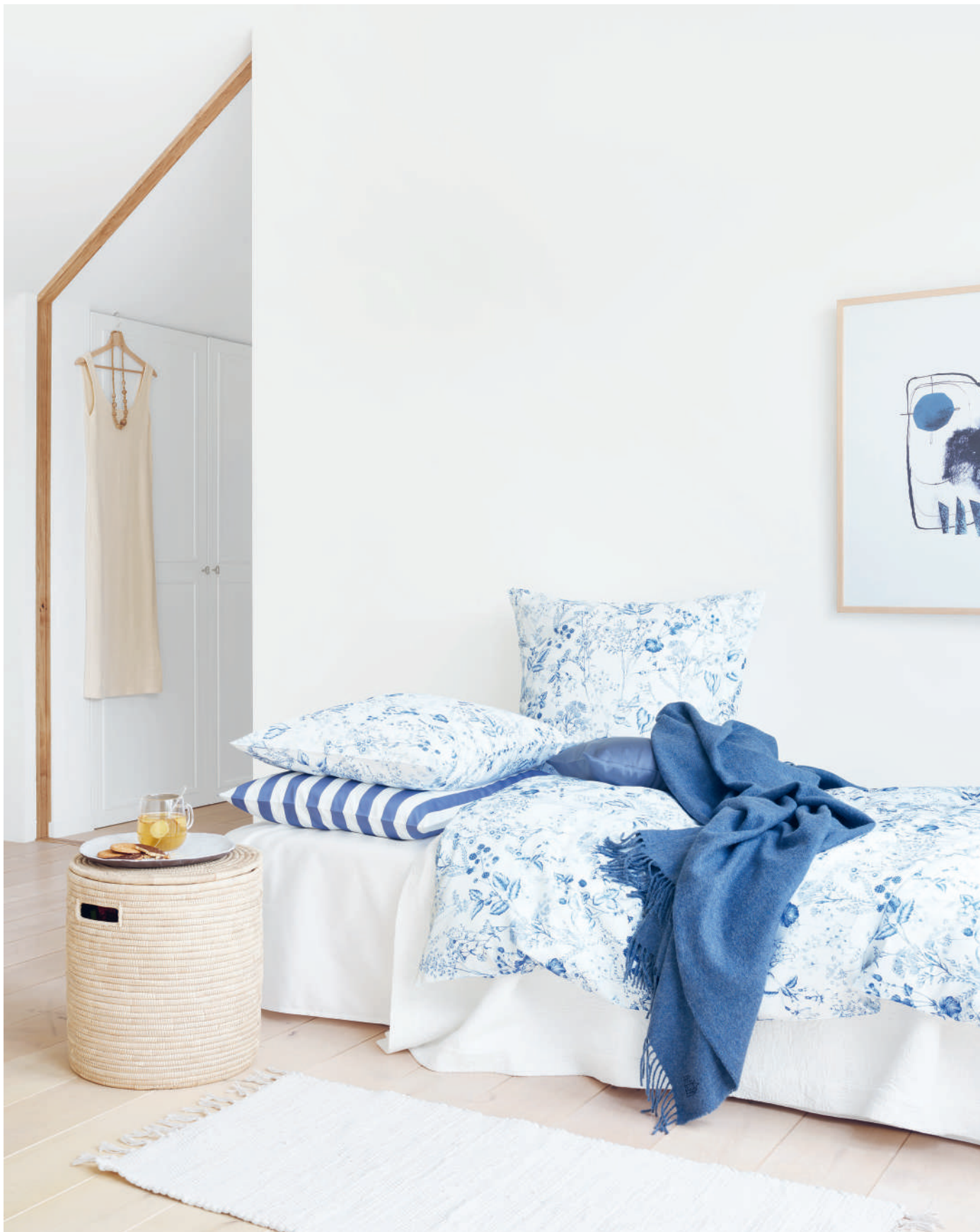
MAYA bleu | RITZ marine | UNI colombine - blanc | Coverlet CASTELLANO blanc | Plaid MILO blue