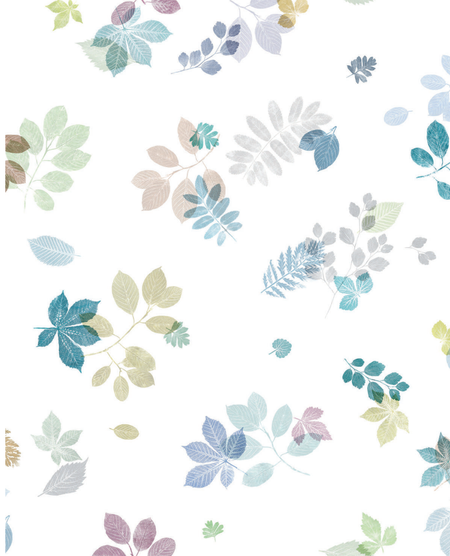
ELIV | Passende Unifarben nuage, acier, galet, menthe, myrtille, glace

Die eindrucksvolle Handwerkskunst von Schlossberg vereint sich mit einem spielerischen Blättertanz auf dem Bett: Eine Vielzahl gesammelter Blätter taucht tief in Ölfarben aus kräftigem Petrol, frischem Lindengrün, warmem Rost und klarem Blau ein. Die Farbabdrücke lassen die zarte Blattstruktur und feinsten Adern detailreich erscheinen – als lägen sie Ihnen noch raschelnd zu Füßen.