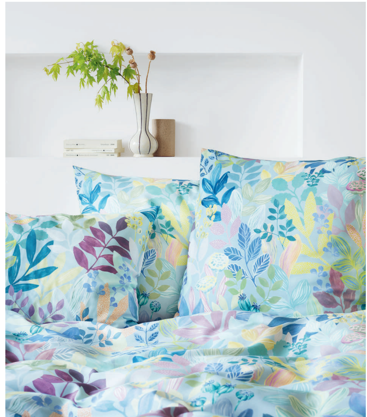
FRIDA bleu | Technik Gouache-Farben

Fallen lassen in die Tiefen eines fantasievollen, zartbunten Blätterwaldes. Diesen einzigartigen Moment genießen und in seidigen Satin oder kuscheligen Jersey abtauchen: Blätter aus frischem Gelb, unzähligen Blautönen, kühlen Fliedernuancen, samtigem Petrol und warmem Bordeaux fangen Sie als Herbstinterpretation der Sommerwiese zwischen Inspirations- und Rückzugsort.