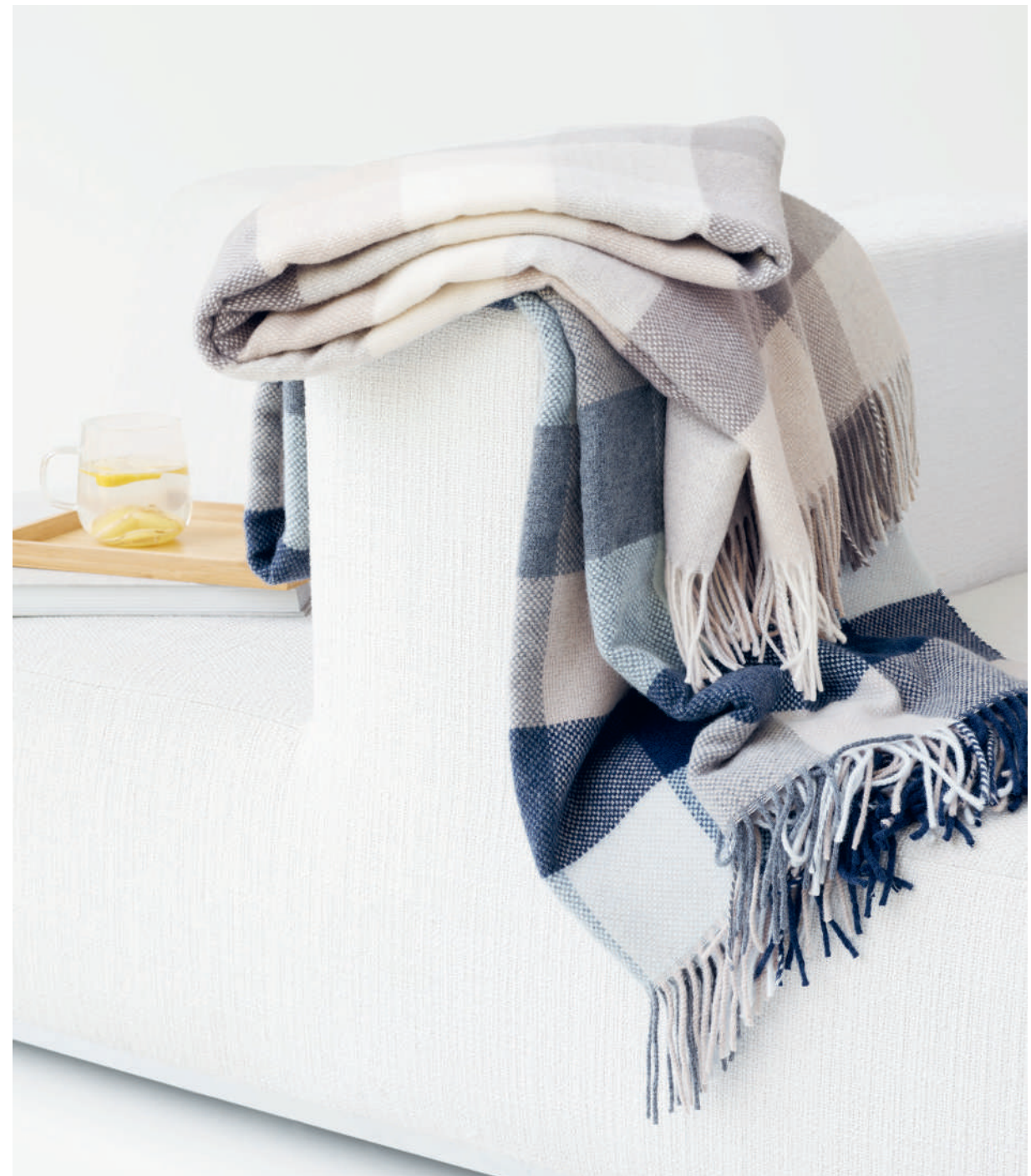
Plaids ANAIS beige - blue

Hochwertigste und natürliche Materialien in zeitlosem Design, mit hohem Kuschelfaktor - wir können nicht genug von den herbst-winterlichen Begleitern zu Hause haben. Ob beim gemütlichen Buch Lesen, der genussvollen Tasse Tee auf dem Sofa oder als wärmender Überwurf: Plaids sind unsere neuen Lieblinge für spontane Wohlfühlmomente.