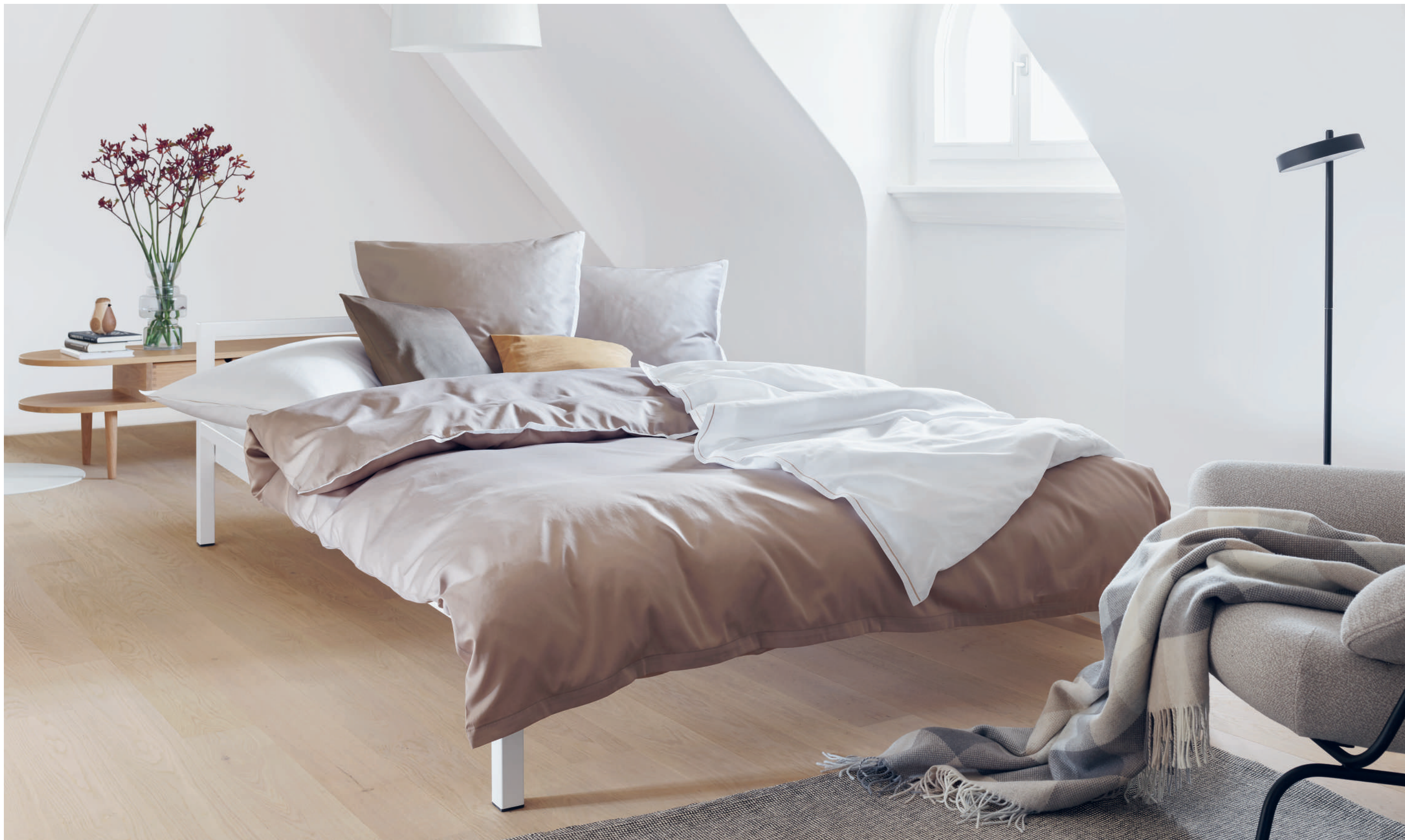
CLARK sable - blanc | EVANS sable | UNI truffe - savane - blanc | Plaid ANAIS beige