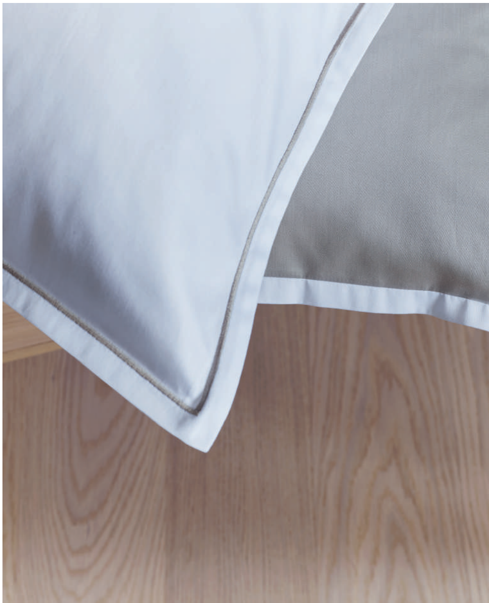
EVANS sable | CLARK sable - blanc