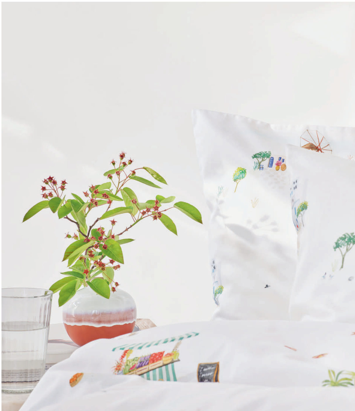
SIESTA blanc | Technik Aquarell