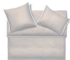
CLARK sable - blanc