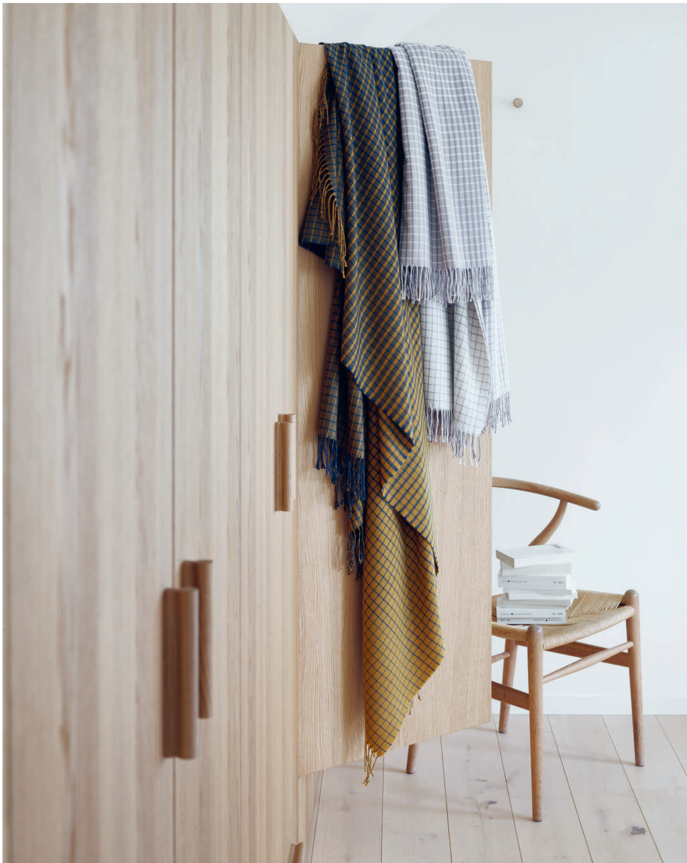
Plaids NANDO teal - taupe