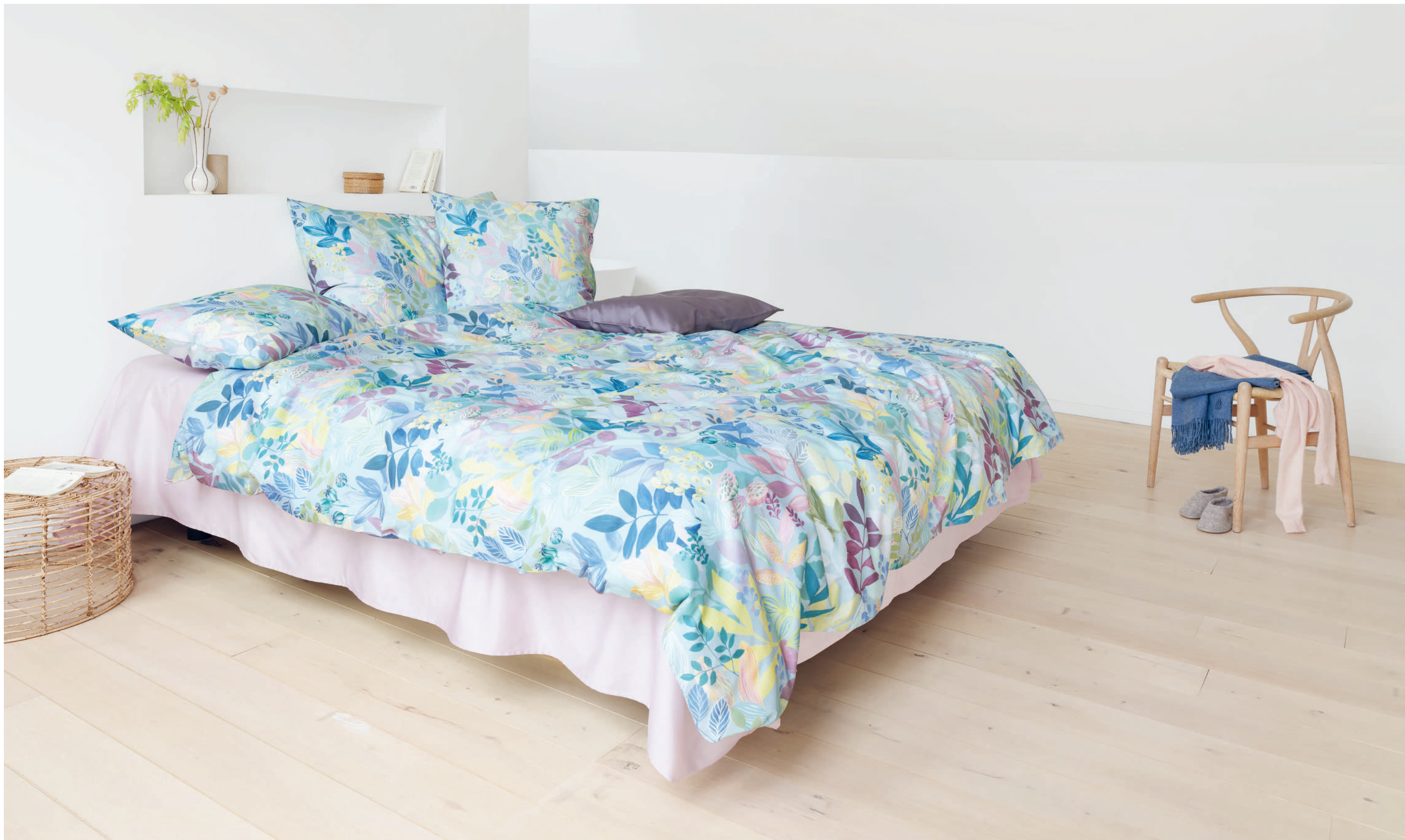
FRIDA bleu | UNI prune - rose | Plaid MILO blue