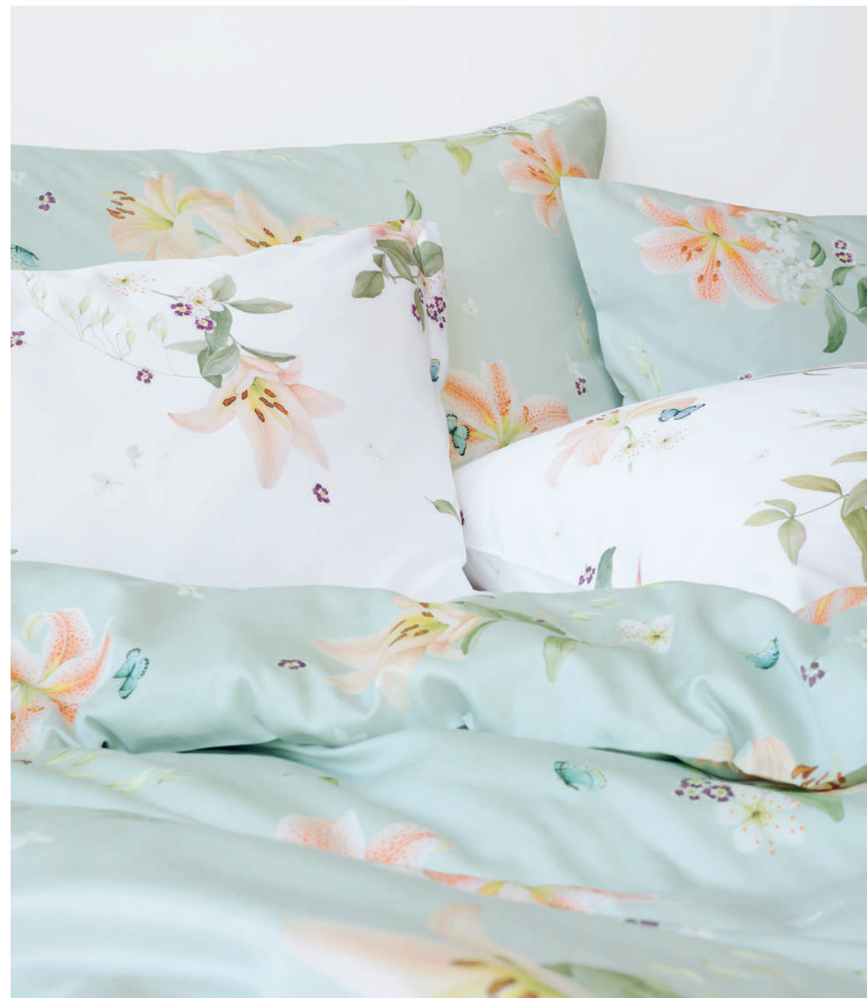
LILIAN blanc - vert | Technik Aquarell

Ein Lilientraum in grosszügiger Eleganz und schwereloser Opulenz: Zart leuchtende lachsfarbene und strahlend apricotfarbene Lilien verstreuen sich über den weissen oder salbeigrünen Fond. Dazu mischen sich Chrysanthemen in frischem Crèmeweiss, flatternde und zarte Schmetterlinge in leichtem Seeblau. Könnte es einen leichteren Start in den Tag geben?