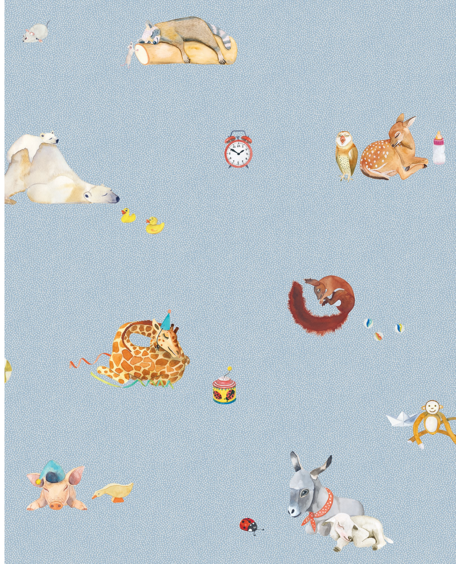
BONNE NUIT | Passende Unifarben perle, brise, colombine, poudre, cayenne, savane, canari

Unter dem Sternenhimmel liegend, eingekuschelt und in bester Begleitung in den Schlaf finden: Die ebenso bunte, wie jetzt ruhend schlummernde Tierwelt hat ein Auge auf friedvolle und sorgenfreie Nächte. Für die kleinsten Träumer gibt es das Bettwäsche-Design auch in Kindergrösse.