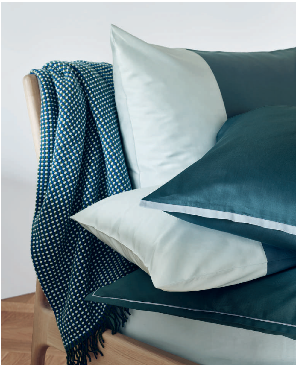
ALLEN sapin - nuage | STEHSAUM Sport | BOURDON Slim | Plaid FELIX green