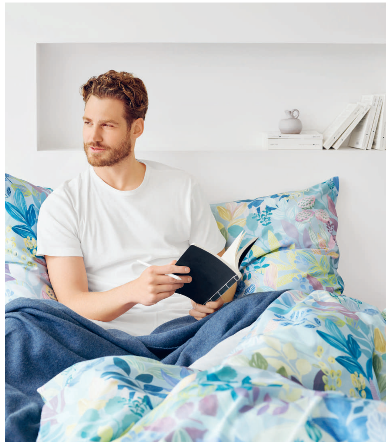
FRIDA bleu | Plaid MILO blue