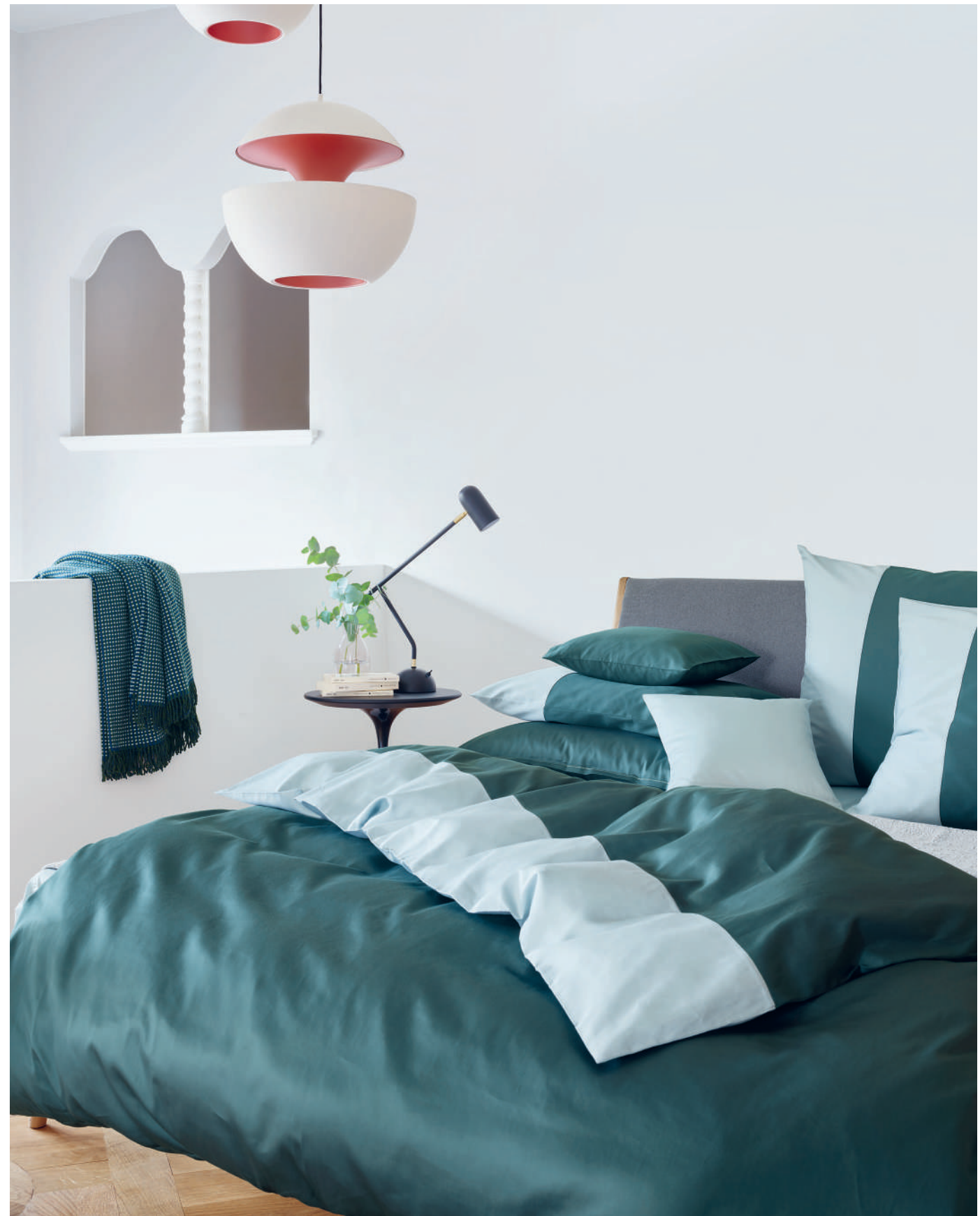
ALLEN sapin - nuage | BOURDON Slim | UNI nuage - sapin | Coverlet CASTELLANO gris | Plaid FELIX green